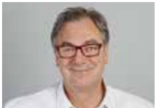
Daniel Schepperle K. Schweizer AG, Schachenmann + Co. AG