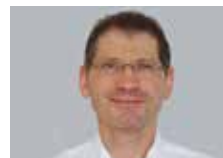
Silvan Erni Elektro Siegrist AG