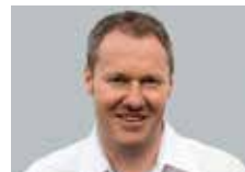
Daniel von Dach Elektro Hunziker AG