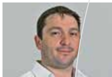
Karl Wyss Schild Elektro AG