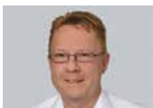
Heinz Haag Oberholzer AG