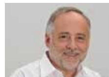
Marco Celio Elettro-Celio SA