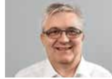
Heinz Lussi Elektro Gutzwiller AG