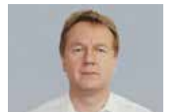
Felix Danuser Schönholzer AG