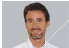
Karl Stark Elektro Zürichsee AG