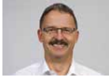
Thomas Neff Eigenmann AG