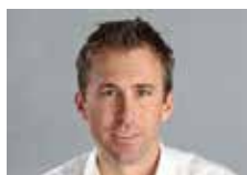
Andreas Handle Elektro Rüegg AG