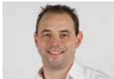
Marc Spühler Elektro Schmidlin AG