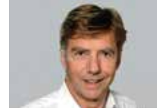
Peter Michel Burkhalter Technics AG