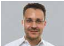
Roger Acklin Burkhälter Elektrotechnik AG

Das macht uns als Burkhälter Gruppe sehr effizient und zusammen mit unserer Strategie der selektiven Auftragsakquise sehr erfolgreich.