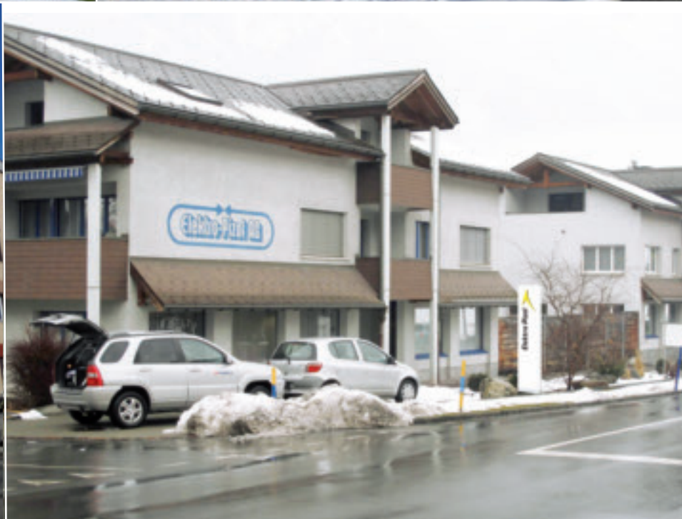
Bildlegende: oben links: Peter&Barbisch, oben rechts: Electra Buin unten links: Grichtung&Valterio SA, unten rechts: Elektro Pizol AG